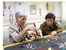
指先を使ったレクリエーション 脳に刺激を♪