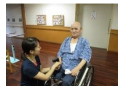
皆さんいつまでも元気でいてくださいね(^o^)/