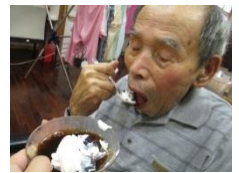
手作りおやつ 8月はかき氷や寒天など、涼しげなものにしてみました(^_^)v