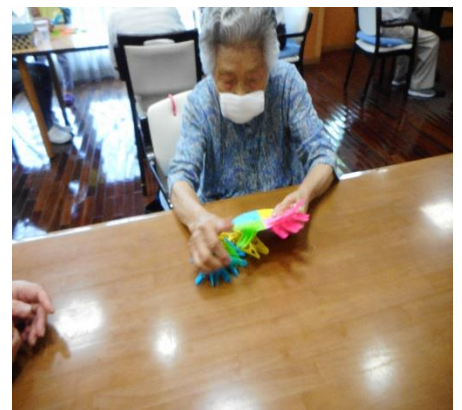
🎮ゲームやレクリエーションも盛り上がっています👉