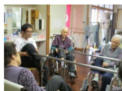
水墨画と転倒予防体操