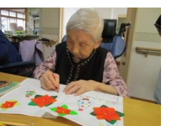
お楽しみレク (カレンダー作り)