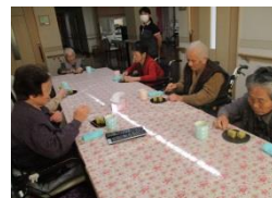
ティーパーティー