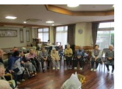
デイとの合同レク (玉入れ)