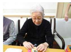
押し花作り (しおり作り)