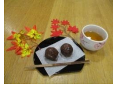
秋を感じる手作りおやつ