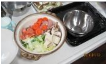
下準備は完璧です！

今年もショートステイ通信を宜しくお願い致します。 寒い気候が毎日続いていますがいかがお過ごしでしょうか、 こんな季節には鍋料理が一番ですよね。ショートステイでも 鍋パーティーを行いました。 皆さん心も体もホカホカに美味しく召し上がりました。