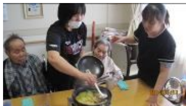
具材を入れてよく煮ます