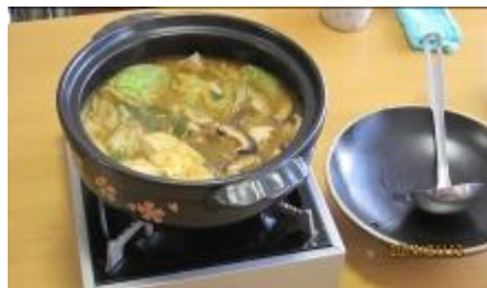
お待ちかねの完成です。 味噌ベースの野菜たっぷり 「松葉園鍋」です。 どうぞ召し上がれ～