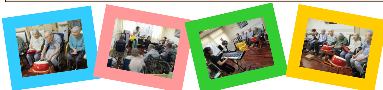
☆音楽会はストレス発散になります！