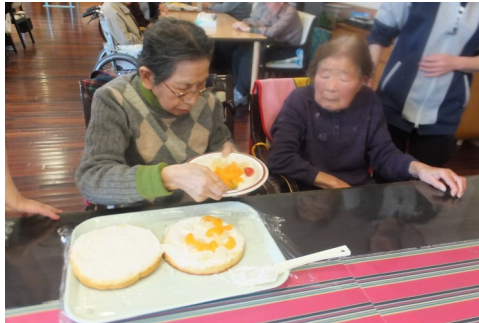
ケーキ作りをしました