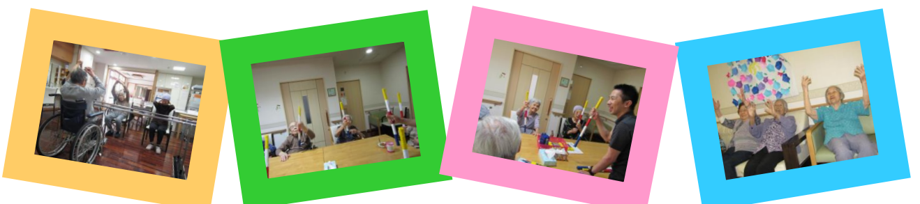
★リハビリ専門職がプログラムを考え、様々な機能訓練を行っています。