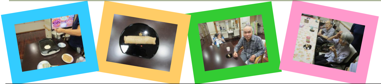
☆八橋を作ってみました(^o^)