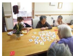
ババ抜きとカルタ