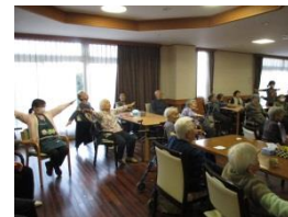
デイサービスとの合同レク

1月はお正月企画で、色んなゲームを職員と一緒に行いました。定番でもある福笑いやカルタを行いましたが、その中でも特に盛り上がったのがジェンガでした。皆様、倒したくないので色々な方向から取れるブロックを探していました。一人の利用者様は「真剣にやって肩がこっちゃった」と言われていました。職員が挑戦して倒した時には大きな声で笑いがおきました。