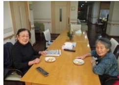
お楽しみレク (ピザ作り)