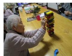
お楽しみレク (ジェンガ)