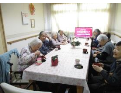
ティーパーティー (おしるこ)